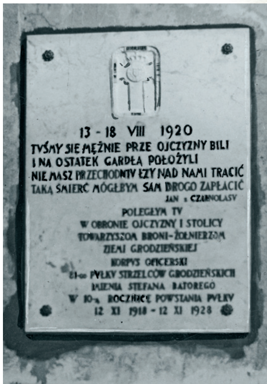
Tablica pamiątkowa ku czci poległych w 1920 r. na cmentarzu w Radzyminie