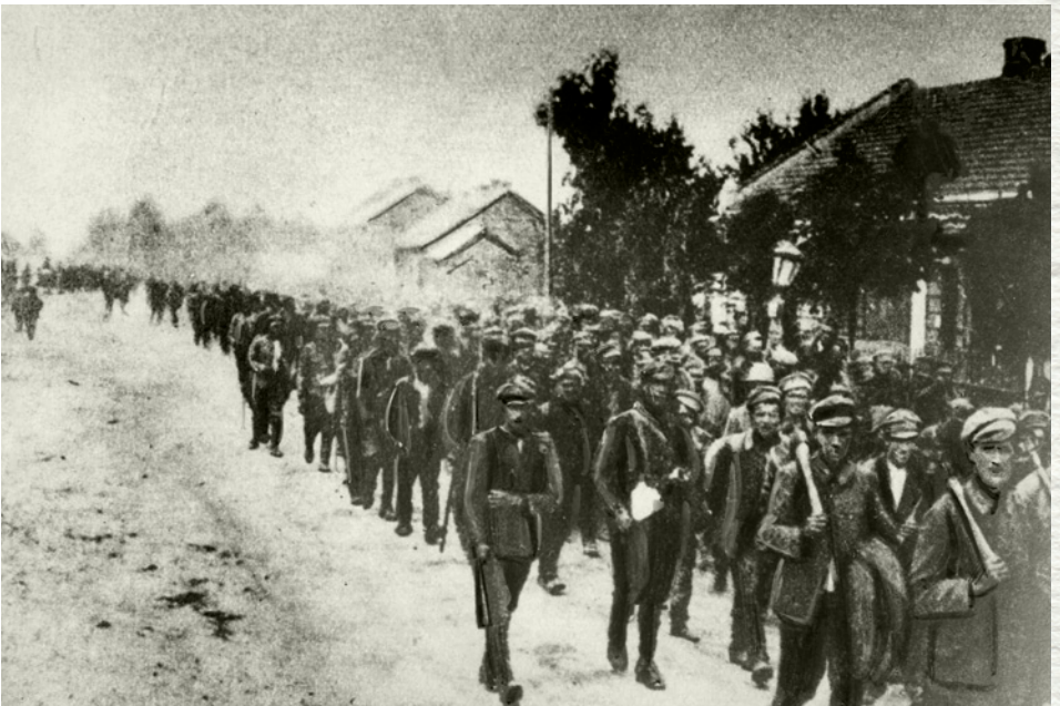
Przemarsz jeńców sowieckich przez Radzymin (NAC)