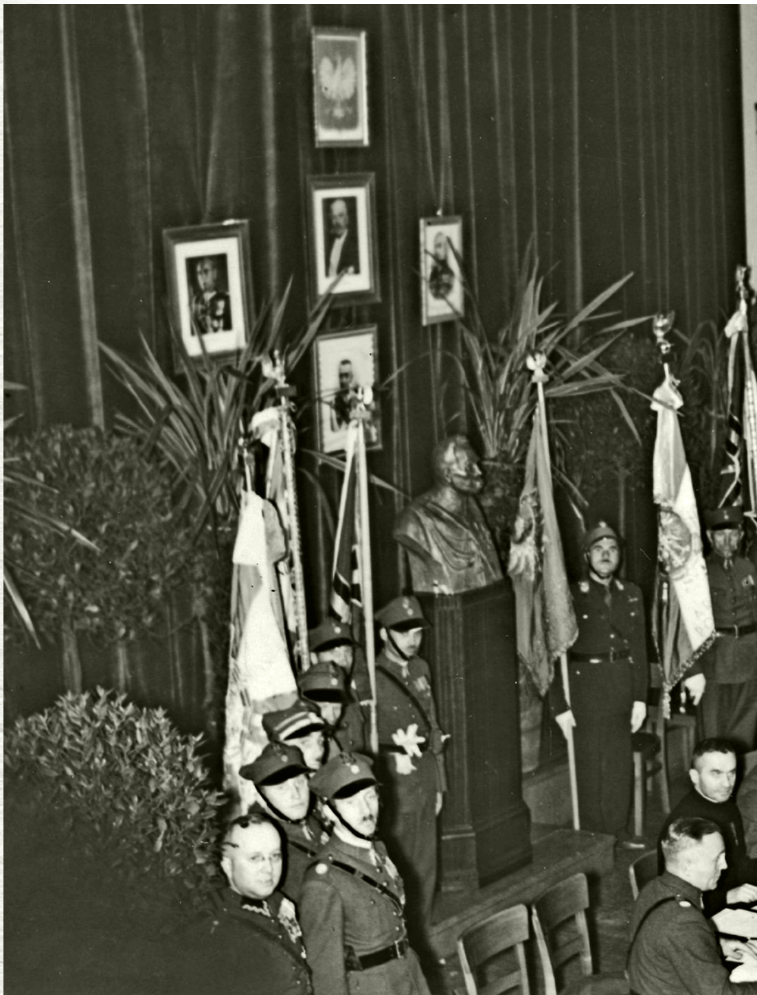
Generał Bronisław Bohaterewicz (siedzi czwarty z prawej strony) na zjeździe Związku Byłych Ochootników Armii Polskiej Uczestników Walk o Niepodległość 1914–1921