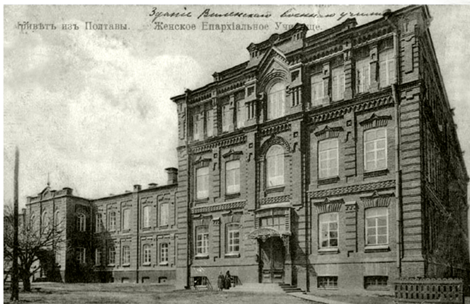
Wileńska Szkoła Junkrów Piechoty (Wikipedia)