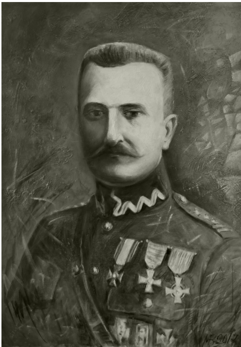
Wasył Martyczuk, Generał Bohaterewicz , fot. Andrzej Pisalnik (Związek Polaków na Białorusi)