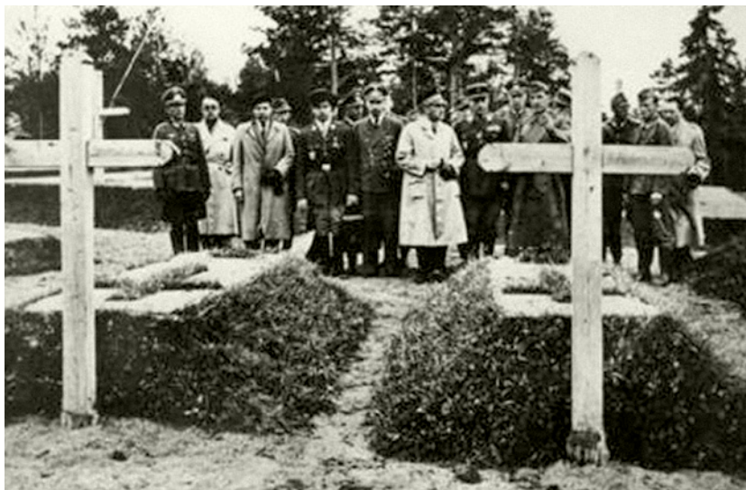
Fernand de Brinon (stoi w środku w białym prochowcu) na czele delegacji francusko-niemieckiej przy grobie gen. Bronisława Bohaterewicza, 1943 r.