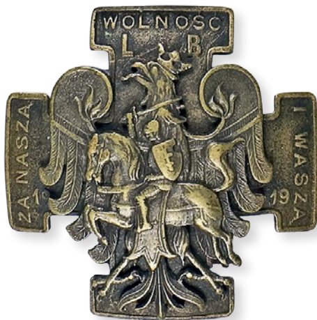
Odznaka Dywizji Litewsko-Białoruskiej