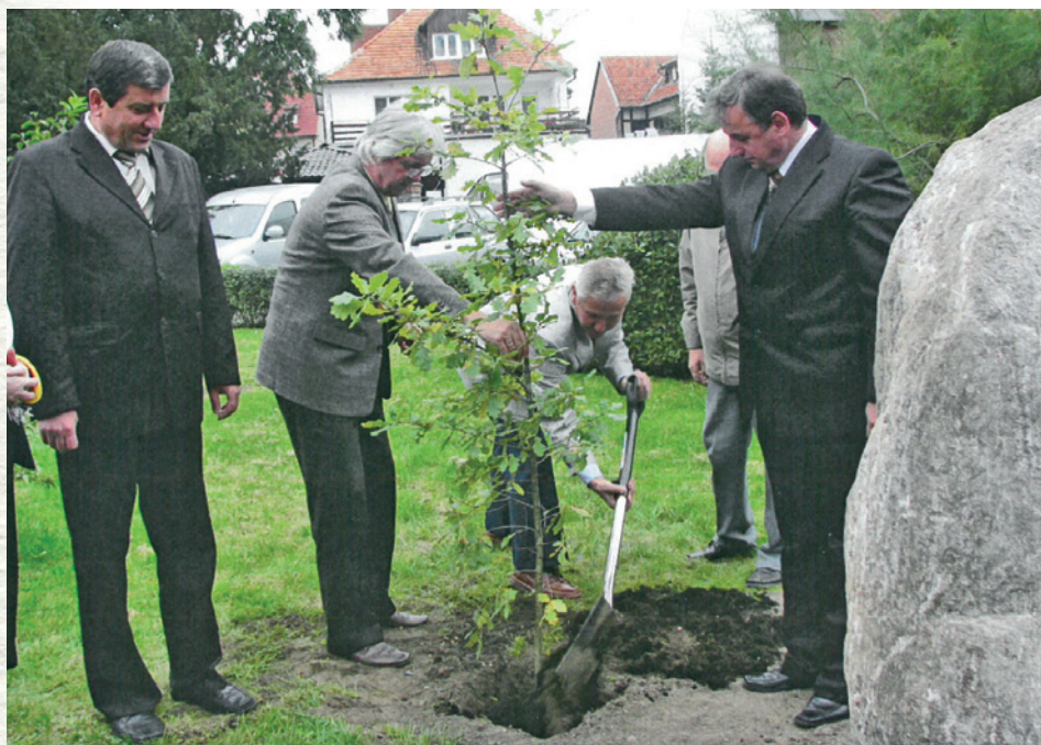
Posadzenie dębu pamięci przed siedzibą Starostwa Powiatowego w Myśliborzu

i Związku Sowieckim kwestia uwiecznienia przez państwo ofiar zbrodni katyńskiej mogła zostać podniesiona. Mimo to przez kilkanaście lat władze państwowe nie zdołały uwiecznić bohatera wojny polsko-bolszewickiej, który swoim heroizmem oraz poświęceniem przyczynił się do powstania Samoobrony Ziemi Grodzieńskiej. Dopiero w 2007 r. Bronisław Bohaterewicz został awansowany przez prezydenta Lecha Kaczyńskiego do stopnia generała dywizji. Ponadto uhonorowano generała w ramach akcji „Katyń... Ocalić od zapomnienia”. Bronisławowi Bohaterewiczowi poświęcone jest jedno z drzew zasadzonych przez Starostwo Powiatowe w Myśliborzu.