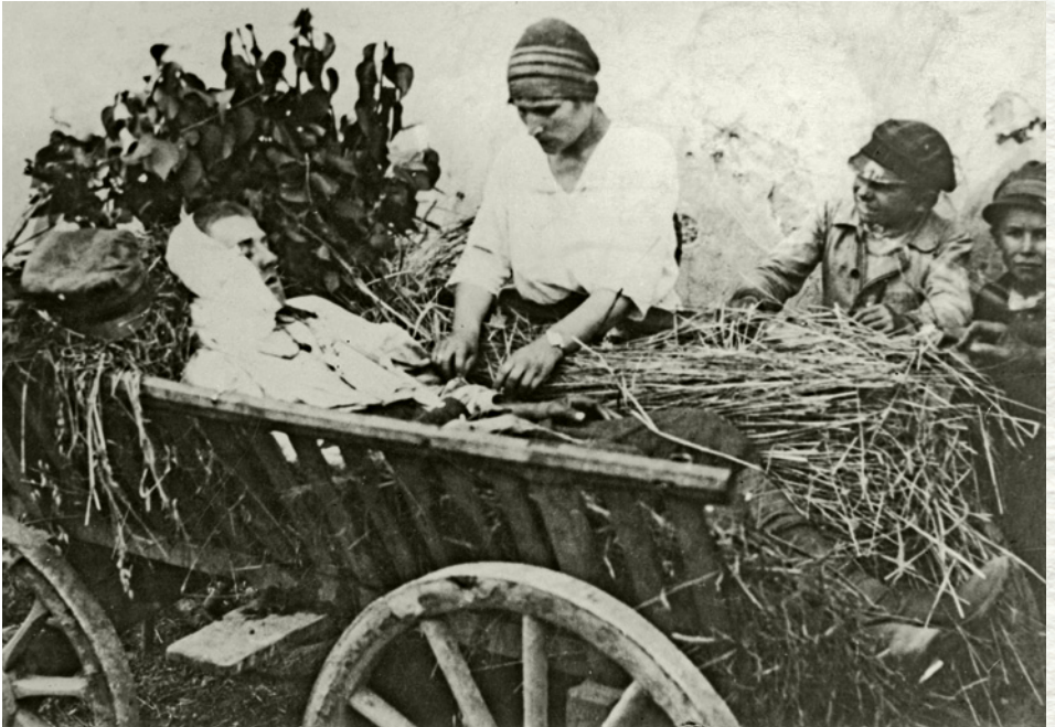
Opatrywanie rannego żołnierza po bitwie pod Radzyminem